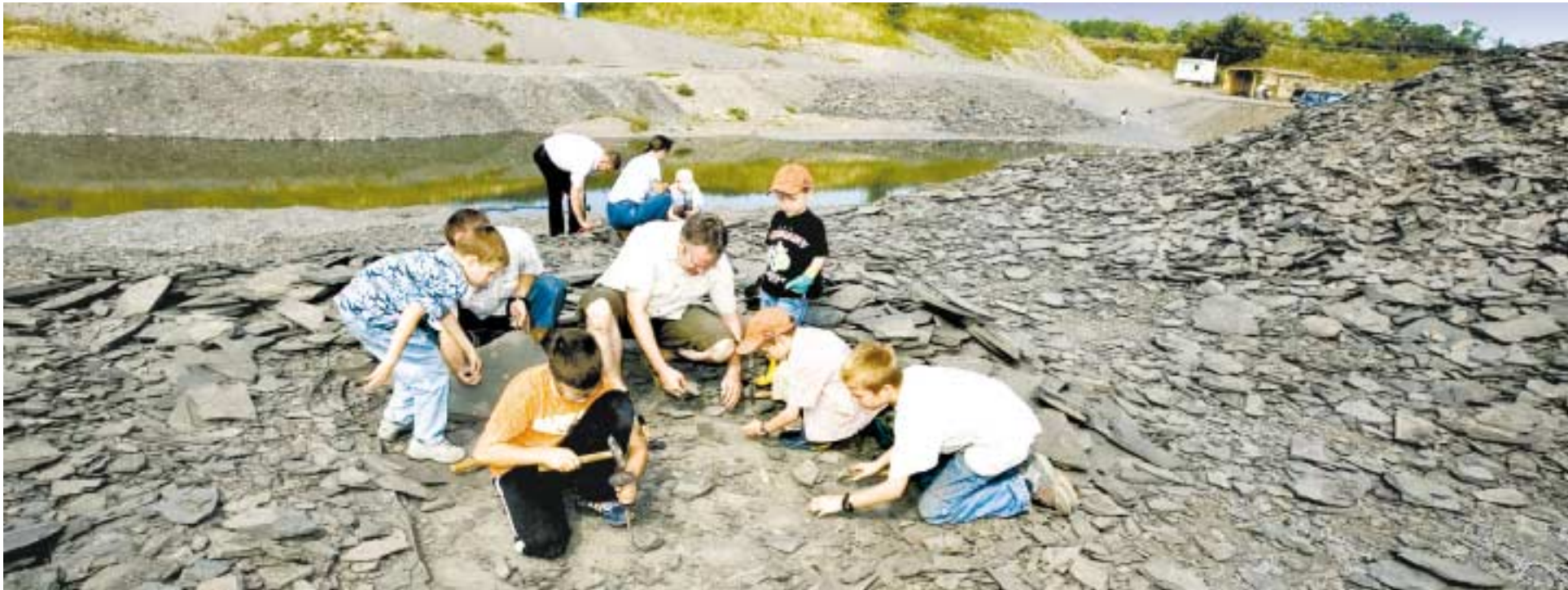
„Auf dem Boden Hand und Knie, kriecht man fort, o süße Müh!“ – so hat Mörike einst die Suche nach Versteinerungen im Schiefersteinbruch beschrieben.