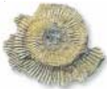
Keine Schnecke, eher ein Tintenfisch